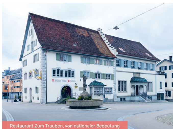
Restaurant Zum Trauben, von nationaler Bedeutung

Neu wird im IDEGO zwischen Objekten von nationaler, kantonaler und kommunaler Bedeutung unterschieden. Diese Kategorisierung ermöglicht eine neue Aufgabenteilung zwischen dem Kanton und den Gemeinden: Der Kanton soll sich nur noch um Objekte von nationaler und kantonaler Bedeutung kümmern. Die Gemeinden sollen im Gegenzug alleine für Objekte von kommunaler Bedeutung zuständig sein und dazu auf ein eigenes Fachgremium zurückgreifen. Die dafür nötige Gesetzesrevision schlägt der Regierungsrat dem Grossen Rat voraussichtlich Anfang 2024 vor. Stimmt der Grosse Rat zu, braucht es künftig für eine Unterschutzstellung eine Verfügung der zuständigen Behörde, wie dies die Städte Frauenfeld und Kreuzlingen bereits seit Jahren handhaben, statt eines pauschalen Schutzplaneintrags, womit Eigentümerschaften in aller Regel zur Unzeit konfrontiert sind und ihre legitimen Interessen nicht erst projektgebunden einbringen können.