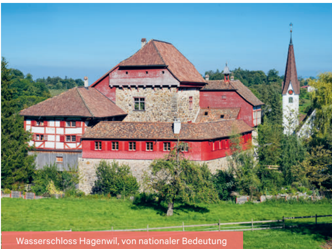
Wasserschloss Hagenwil, von nationaler Bedeutung