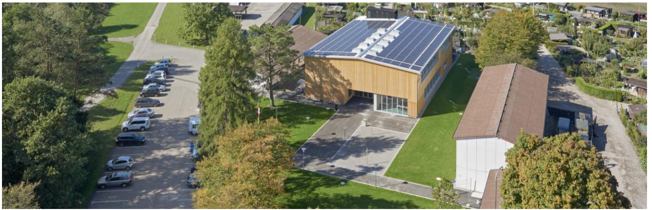
Gemeinsame Veranstaltung VTG und Staatskanzlei