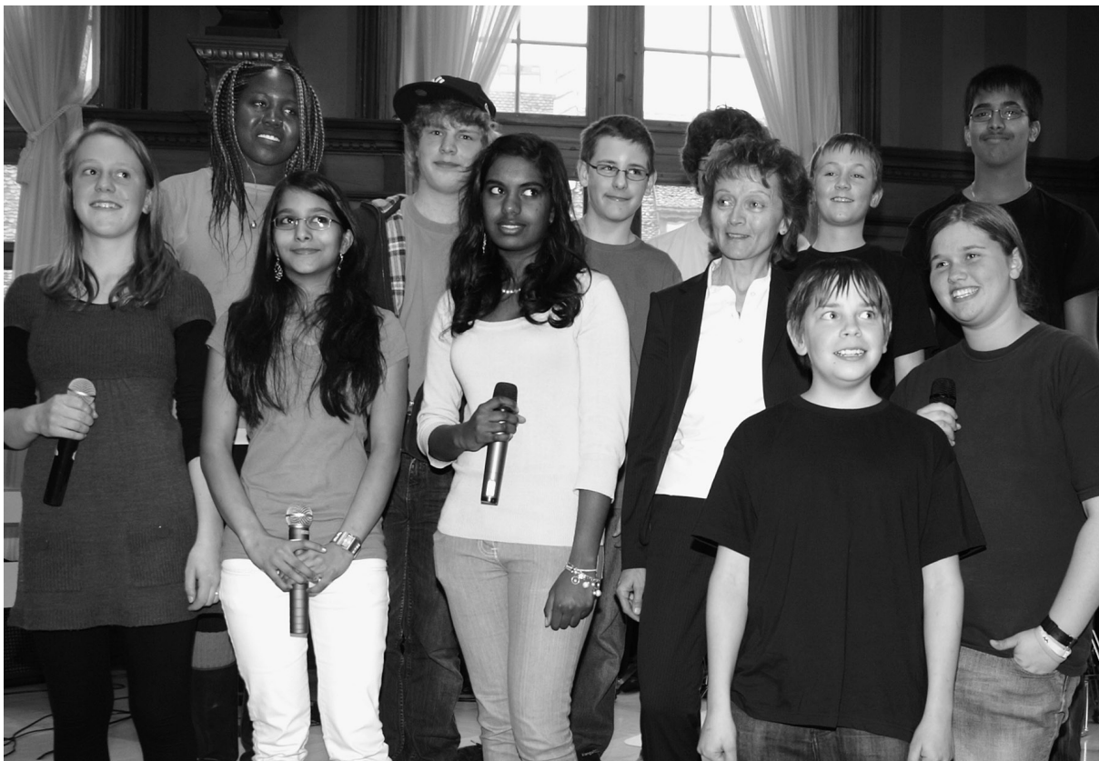
Schülerband Colours mit Bundesrätin Eveline Widmer-Schlumpf