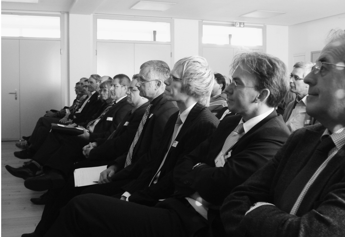
Am 28. Oktober 2010 trafen sich über 60 Finanzverantwortliche der Thurgauer Gemeinden zu einem interessanten Nachmittag.