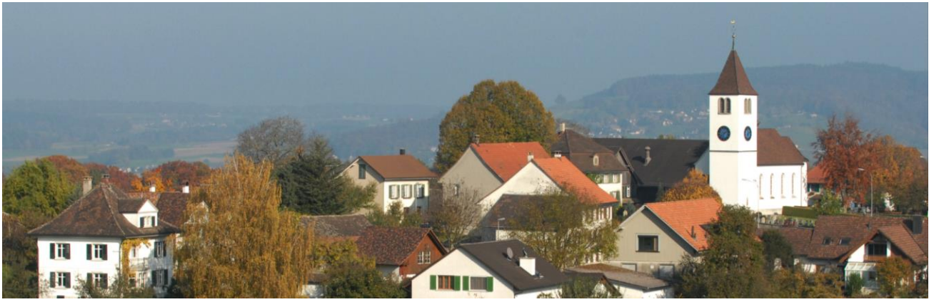
Fachtagung Ressort Bau, Werke, Umwelt