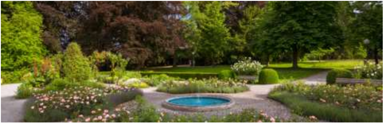
Fachtagung Ressort Steuern