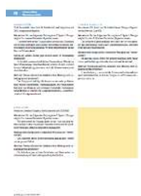
1/8 Seite 85 x 65 mm