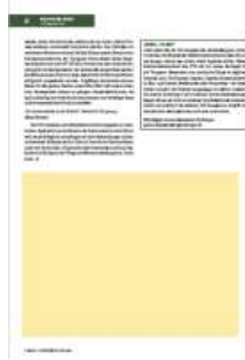
1/2 Seite 175 x 135 mm