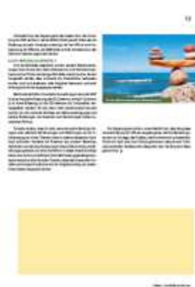
1/4 Seite 175 x 65 mm